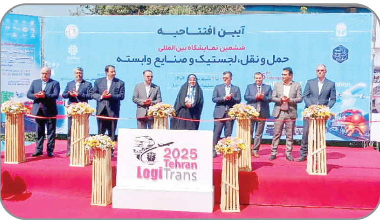
برگزار کرده است و امسال بر اساس مجوز سازمان توسعه تجارت، نمایشگاه حمل و نقل و لجستیک