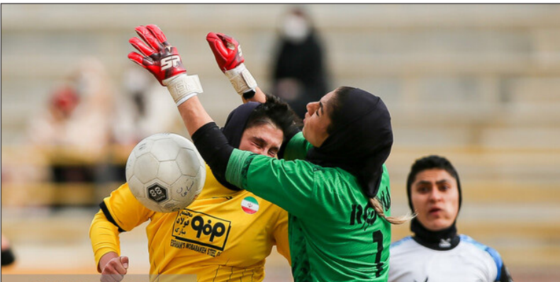
عملکرد نسبتا خوبی داشت. با این حال چند مهره کلیدی خود را از دست داد و برای پر کردن این خلأ، به سمت همکاری و ترکیب با بازیکنان یک تیم شمالی رفته است. سپاهان اصفهان - نماینده کردستان خاتون بم - تام اصفهان پالایشگاه ایلام - سپاهان اصفهان تام اصفهان - نماینده کردستان قهرمانی است که البته برای فصل آتی کمی غیرممکن به نظر می رسد و تام هم تلاش می کند جایگاهش را در سطح اول فوتبال زنان ایران تثبیت کند.

سپاهان و تام اصفهان در فصل جدید لیگ برتر فوتبال زنان، با قرعه کشی پرچالشی مواجه شده است. با برگزاری مراسم قرعه کشی لیگ برتر فوتبال زنان «جام کوثر» برنامه مسابقات فصل ۱۴۰۵ - ۱۴۰۴ مشخص شد که در میان تیم های حاضر، دو نماینده اصفهان یعنی سپاهان و تام حضوری پررنگ خواهند داشت؛ تیم هایی که شرایط متفاوت دارند، اما هدفی مشترک که درخشش در سطح اول فوتبال زنان کشور است را مقابل چشم خود می بینند. سپاهان که سال هاست در لیگ برتر حضور دارد، همچنان در حسرت قهرمانی است. زردپوشان فصل گذشته با وجود نزدیکی به صدر جدول، در هفته های پایانی مقابل خاتون بم لغزیدند و به مقام نایب قهرمانی بسنده کردند. این تیم در تابستان پرچانشاه اخیر، ستاره های ملی پوش خود را از دست داد، اما با جذب بازیکنان جوان و تکیه بر آکادمی، مسیر تازه ای را در پیش گرفته است. تام اصفهان، اما شرایطی متفاوت دارد. این تیم که دو مین فصل حضورش در لیگ برتر را تجربه می کند، سال گذشته با وجود مشکلات مالی برنامه بازی های سپاهان و تام اصفهان در لیگ برتر فوتبال زنان، با این حال چند مهره کلیدی خود را از دست داد و برای پر کردن این خلأ، به سمت همکاری و ترکیب با بازیکنان یک تیم شمالی رفته است. سپاهان اصفهان - نماینده کردستان خاتون بم - تام اصفهان پالایشگاه ایلام - سپاهان اصفهان تام اصفهان - نماینده کردستان قهرمانی است که البته برای فصل آتی کمی غیرممکن به نظر می رسد و تام هم تلاش می کند جایگاهش را در سطح اول فوتبال زنان ایران تثبیت کند.