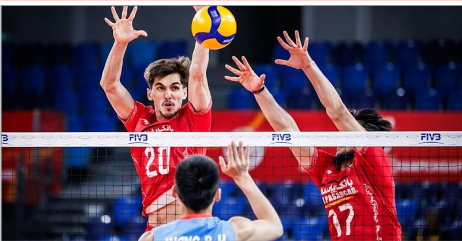
والیبال جوانان جهان

دیدار هفته سوم استقلال مقابل استقلال خوزستان، پس از پایان تعطیلی فیفای، روز جمعه ۲۱ شهریور از ساعت ۲۰ برگزار خواهد شد و این بازی فرصت مناسبی برای سایپینو است تا عملکرد تیمش در دفاع را اصلاح کند و نشان دهد استقلال می تواند با ساختار دفاعی منسجم تر وارد رقابت های لیگ برتر شود.